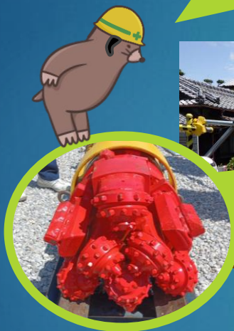
先導体吊降ろし状況

先導体の先はこんな風にごつごつしてるよ！ これを回転させて、地下を削りながら進むんだ！