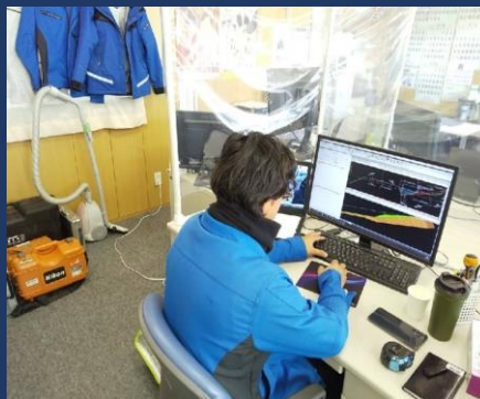
3次元設計データ作成 （4年目）

本工事は、若手技術員が3名います。その為、担い手確保のために若手技術員は様々なことを行っております。4年目の技術員は工事に必要な3次元設計データを作成しています。新入生は作成したデータとリンクした快測ナビを使用し、測量を行っております。このように事務所でも、現場でも若手技術員が活躍しています。