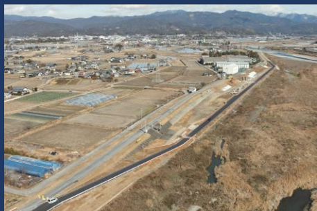
現在の進捗状況 （ドローンによる空撮）

1月から、現場では覆土工が始まりました。現在、多くの大型車両が道幅の狭い堤防上を通行しています。安全第一で作業を進めていくために、法定速度の厳守・交通誘導員の配置を行い、一般車両優先で作業を行います。地域の皆様、堤防上・仮設道路を通行する方々には大変ご迷惑をおかけしますが、安全第一で作業を進めていきますので、ご理解・ご協力のほど宜しくお願い致します。