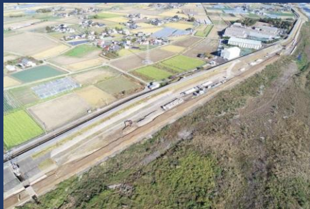
現在の進捗状況 (ドローンによる空撮)

11月から、現場では築堤盛土・工専用道路盛土が始まりました。現在、多くの大型車両が堤防上を通行しています。そのため、現場出入口につきましては非常に混雑し、通行中の皆さまには大変なご迷惑とご協力をお願いしています。私達は、皆様の安全第一で作業を進めておりますので、今後ともご理解・ご協力のほど宜しくお願い致します。