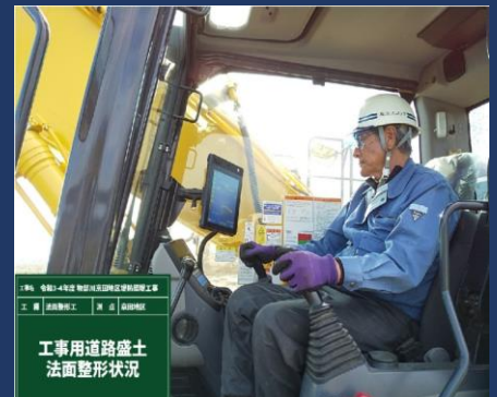
ベテランオペレーター