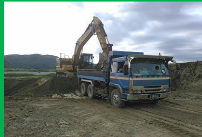
ペイロードシステム を使用した土砂積込状況