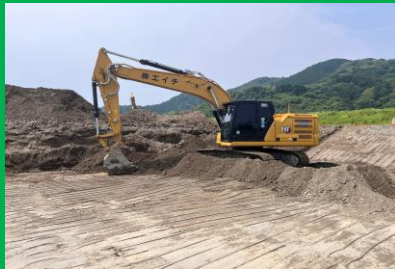
マシンコントロール バックホウによる掘削状況