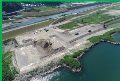
現場全体の空撮写真

現在、河床土の掘削・運搬作業を行っております。 掘削作業や法面整形では、ICT建機を使用することで無丁張化で実施し、積込の際はペイロードシステムを使用し過積載に注意しながら作業を実施しています。