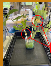
ジャコウアゲハの蛹

工事区域内にはジャコウアゲハ(希少種)が卵を産み付けるウマノズクサが群生しており、地元の保護活動を行っている方と連携しながらジャコウアゲハの保護に努めています！