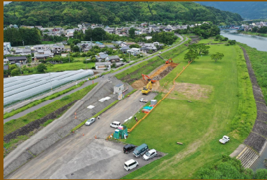
空撮写真(現在の現場状況 上流側・下流側)

6月下旬現在、坂路を挟んで上流班・下流班に分かれて施工しています。上流側は緑地公園を含む約80m、下流側は坂路から下流側約200mを立入禁止措置を行い施工しています。現在は主に掘削作業を行っており、ICT建機を活用することで半自動制御にて施工することができ、時間・労力を大幅に削減することができます。